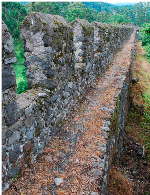
U góry: Górne partie murów przebudowane w okresie tureckim. Ściana północna. U dołu: Członkowie ekspedycji przy wejściu od strony zachodniej. Sezon 2014

badania nieinwazyjne na terenie fortu. Wykonano pomiary geofizyczne metodą magnetyczną, a także pomiary geodezyjne i zdjęcia z powietrza. Na tej podstawie możliwe było uzyskanie nowych informacji na temat pozostałości zabudowań kryjących się pod ziemią wewnątrz umocnień. Na podstawie wyników badań geofizycznych opracowano czarno-białe mapy zmian wartości natężenia pola magnetycznego, wskazujących m.in. na występowanie pod powierzchnią gruntu pozostałości zabudowań. Uzyskane wyniki pozwoliły na wytypowanie najlepszych miejsc pod przyszłe wykopaliska.